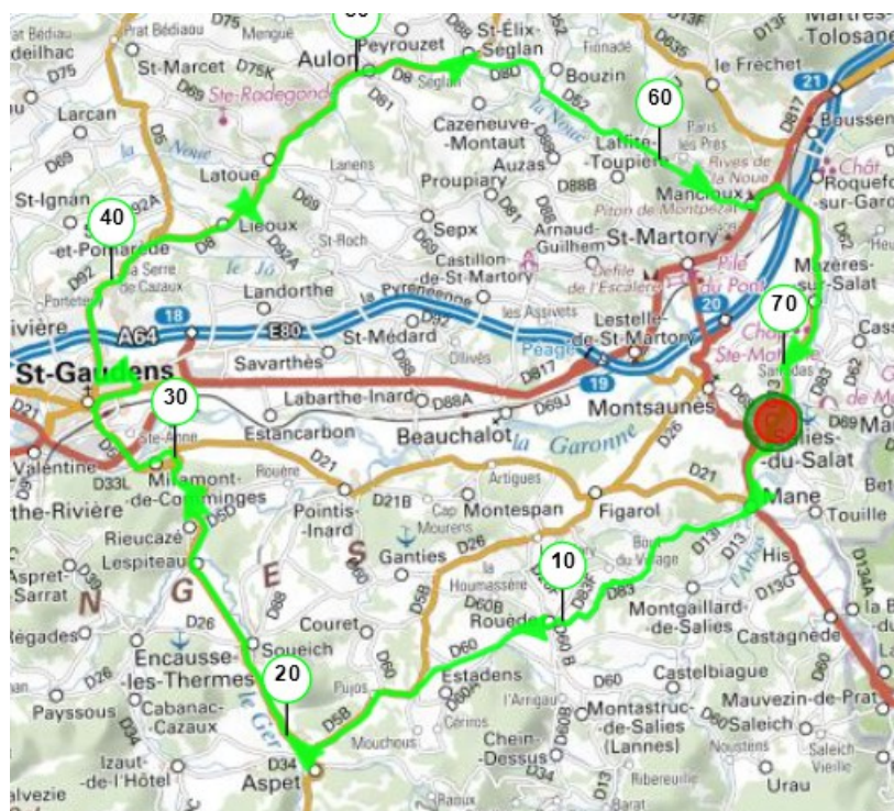
Parcours effectué pour la Concentration

Le CR Muret devant la Maison Chappert avant de reprendre la route vers la Serre de Cazaux, Liéoux, Latoue, Aulon, Saint Elix Séglan, et Mancieux pour rejoindre Salies du Salat où nous nous sommes retrouvés à la table de l'Hotellerie du Centre pour y déguster un bon repas en toute convivialité.