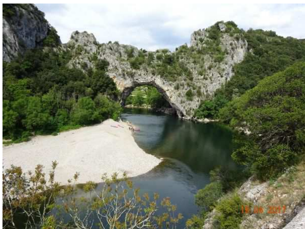
A la sortie des gorges, le fameux pont arc sur l'Ardèche d'où le nom de la ville voisine de Vallon Pont d'Arc.