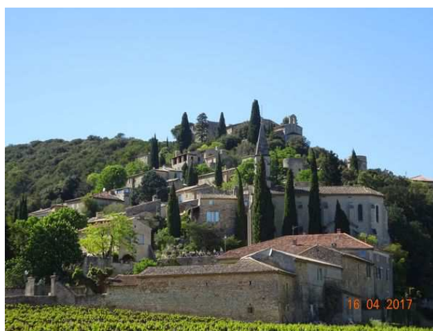
Cascades du Sautadet sur la Cèze au pied de La Roque sur Cèze La Roque sur Cèze est un petit village médiéval construit sur un piton rocheux.