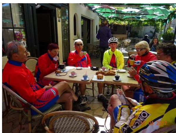
Départ devant l'hôtel pour la dernière étape le Lundi Pause café chocolatine à Barjac qui a obtenu le label village de caractère