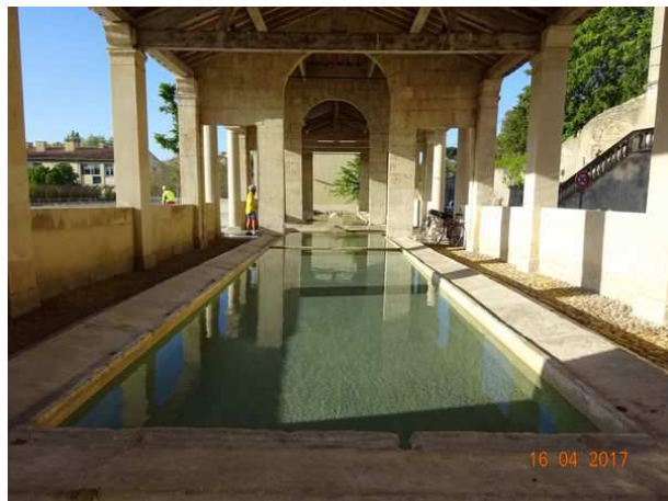
Départ de l'hôtel pour la Concentration pascale à Vénéjean, et le lavoir de Pont Saint Esprit construit en 1832