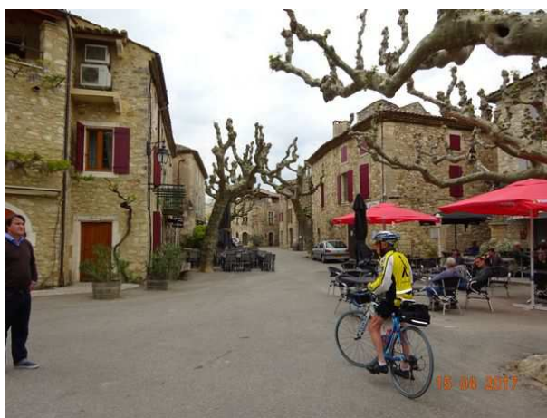
Ruelle de Labastide de Virac où se situe le château des Roures, et la place du petit village d'Aiguèze