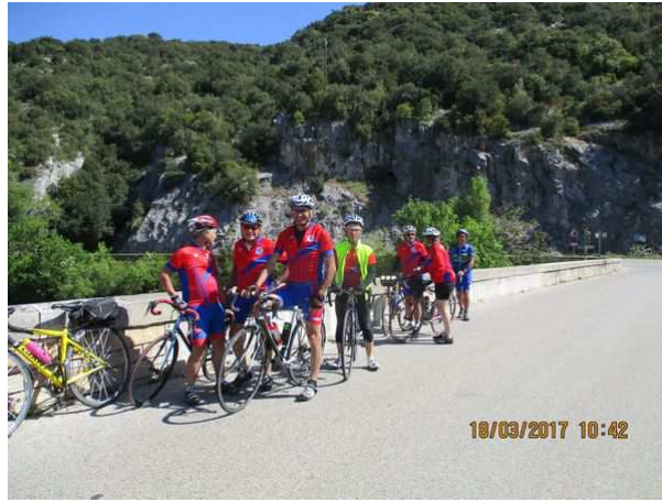
Pause sur le pont enjambant la Cèze entre Montclus et Goudardes, non loin des cascades du Sautadet