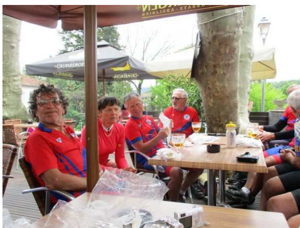
Le CRMuret pose devant le pont de Vallon Pont d'Arc, retrouvailles des 2 groupes à Vallon Pont d'Arc lors de la pose casse-croûte