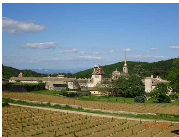
Chartreuse de Valbonne qui était un monastère de moines-ermites de l'ordre des Chartreux