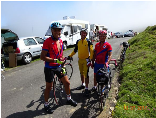
Regroupement pour effectuer les 2 derniers kilomètres pour atteindre le Port de Balès