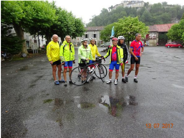
Le groupe au départ