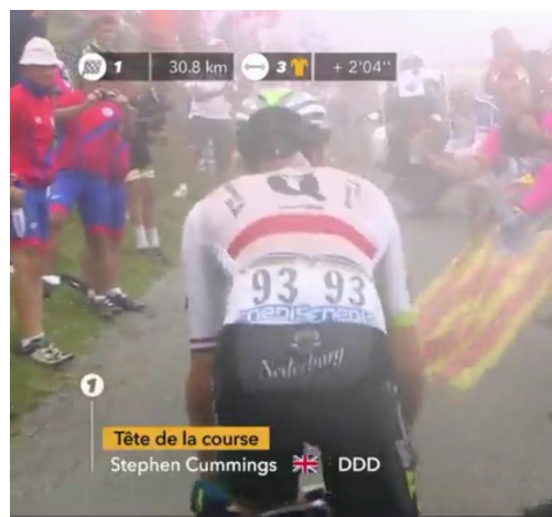
Capture d'images du reportage télé, sur lesquelles les couleurs du CRMuret sont visibles.