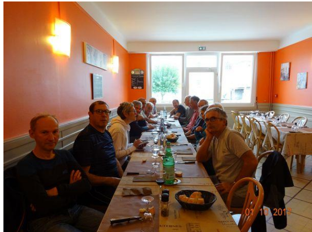
Après l'effort, le réconfort devant une assiette au restaurant La Flamme Rouge à St Giron