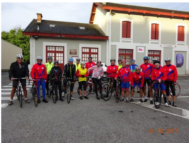
Le CRMuret devant l'ancienne gare de St Girons

Nous avons terminé cette belle randonnée en Couserans par un repas au restaurant.