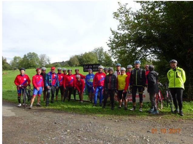
Le CRM à la concentration des Col Durs et des 100 cols au col de Rille