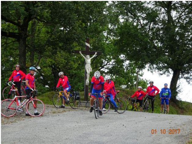
Le CRMuret sous la bienveillance du Christ à Montesquieu Avantès