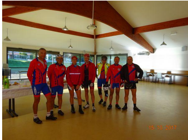
A la salle des Fêtes de Gourdan Polignan