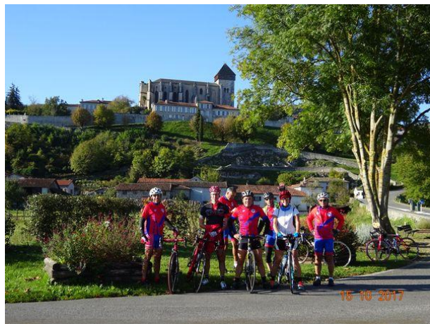
Pause devant la cathédrale Notre Dame de Saint Bertrand de Comminges