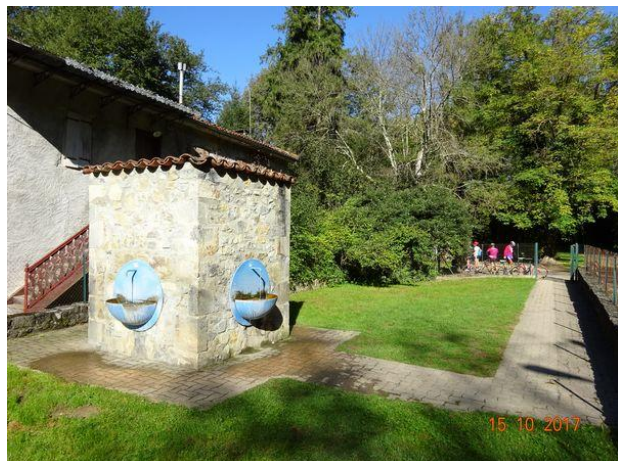
Sources de Ganties