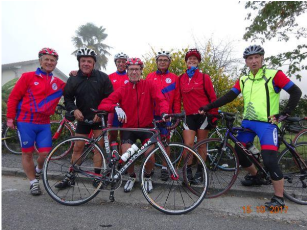
Au départ sur le parking du restaurant l'Etable

8 cyclos furent présents pour la Fermeture du Codep31 pour un circuit de 70 km moyennement vallonné. Au départ un temps brumeux avec une température minimale de 9°C, mais sans vent. Nous fûmes bien accueillis par les cyclos de Gourdan Polignan à la salle des Fêtes.