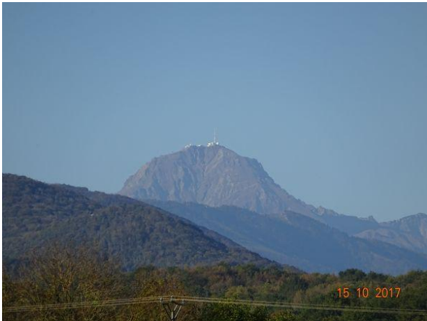
Le Pic du Midi