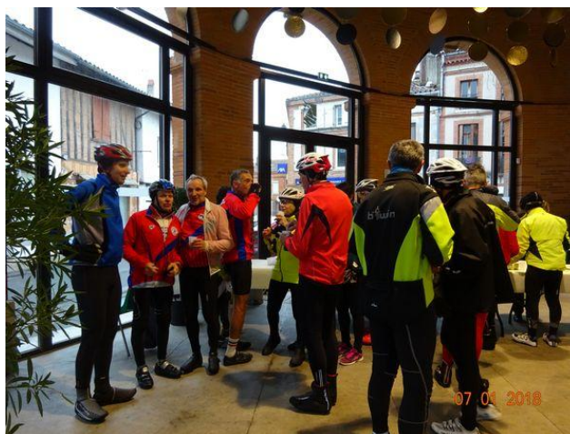
Accueil au point café sous la halle à Rieumes