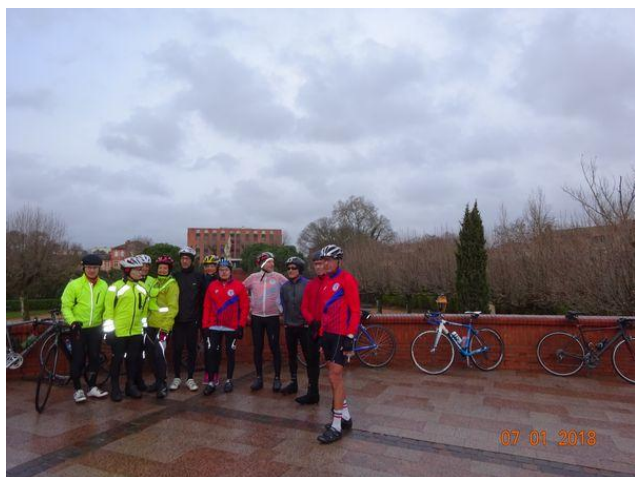
Le groupe au départ de la salle des Fêtes