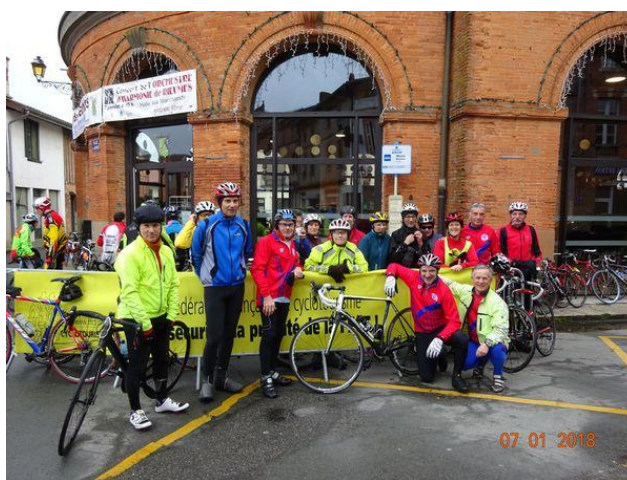
Avant de reprendre le cours de la sortie