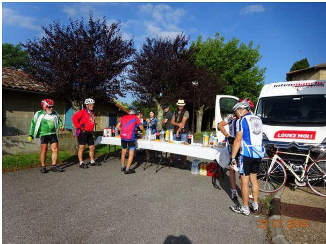
Ravitaillement à Riolas