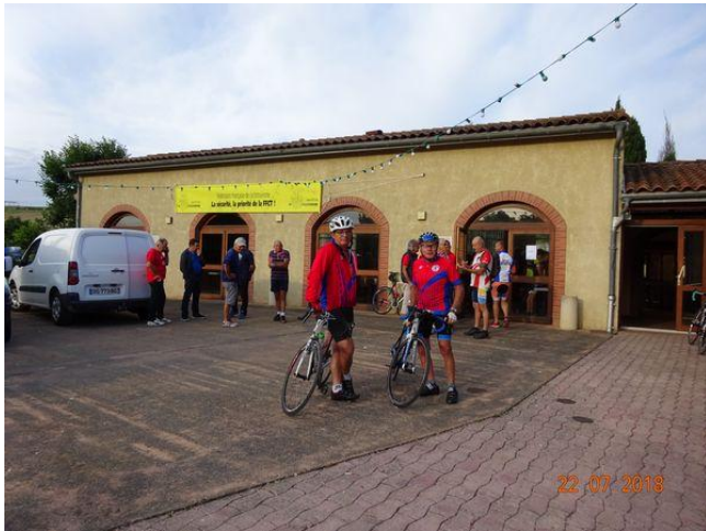
Les Muretains présents au départ

A la Randonnée de la Vallée du Touch organisée par le club de Labastide Paumès, les Muretains ne furent pas très vaillants pour y participer, seulement 4 cyclos. Très joli parcours avec des paysages magnifiques.