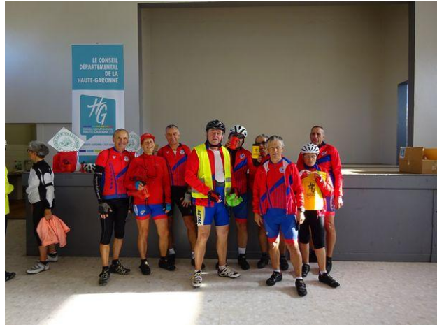
Le CRMuret à la Concentration