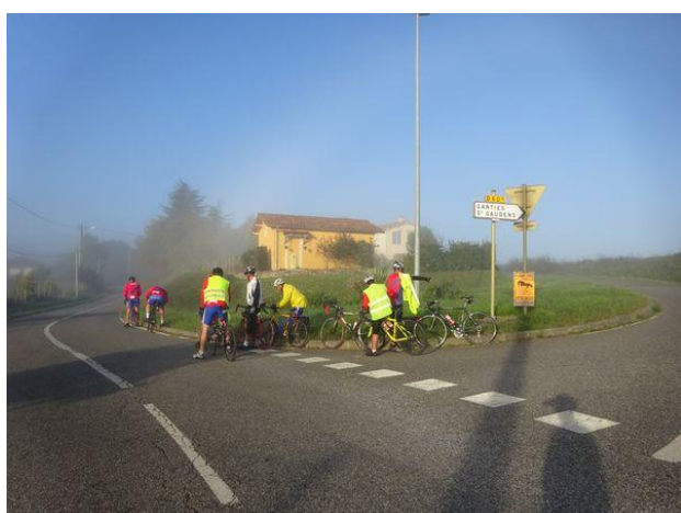
Regroupement au sommet de Lasserre, où nous retrouvons le soleil