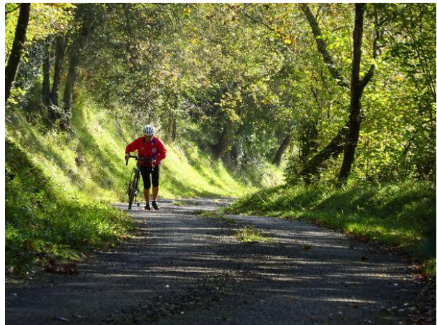
Dur, dur pour Claudine