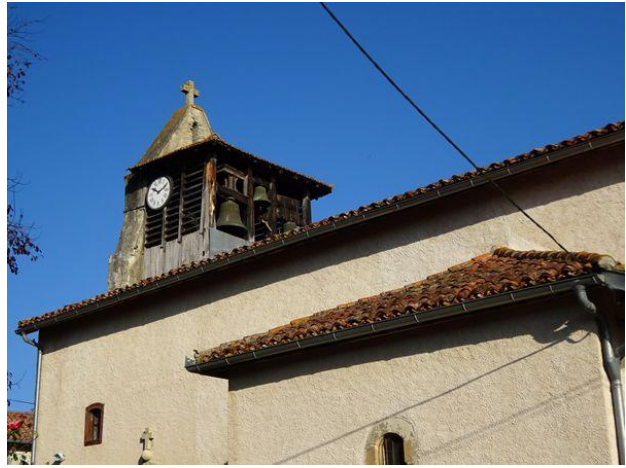
Le clocher de l'église Saint Jean-Baptiste de Regades