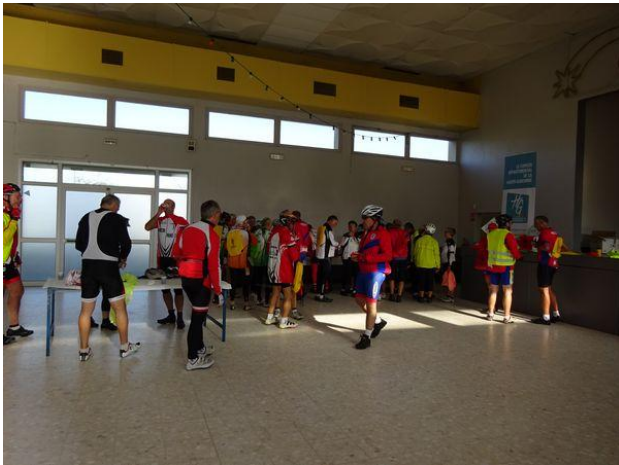
Le point rencontre à la Concentration à la salle des Fêtes de Valentine