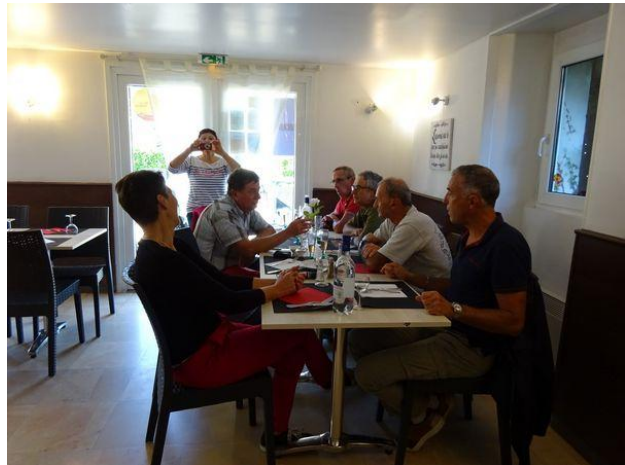
Après cette agréable sortie le groupe s'est retrouvé autour d'une table au restaurant à Salies du Salat