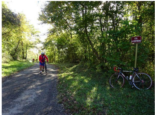
Axel qui termine le col à pied