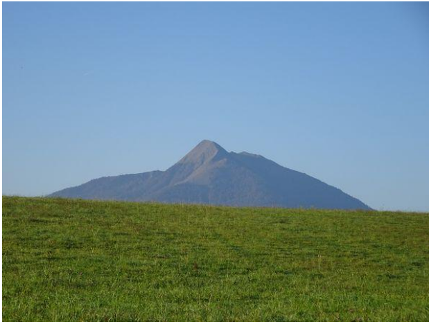
A Estadens le Cagire a enlevé son manteau brumeux