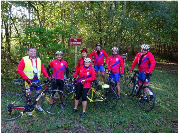
Pause bien méritée au col de Mountmédan