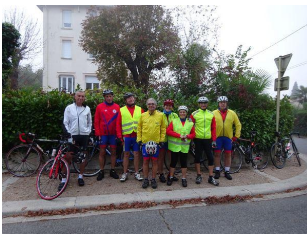
Les 9 cyclos Randonneurs Muretais au départ de Salies du Salat