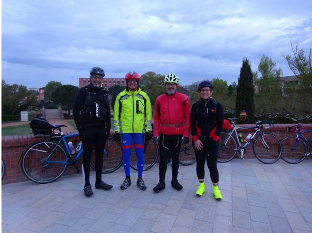
Les Muretains au départ