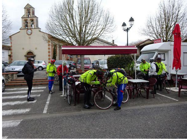
Pause café et pointage à Lescosse