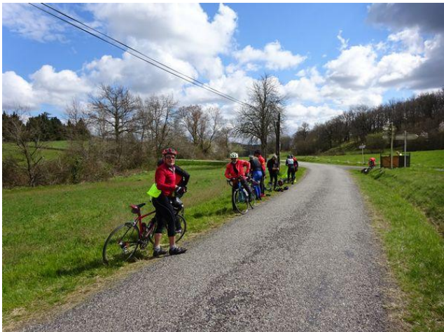
Arrêt car il commence à faire chaud