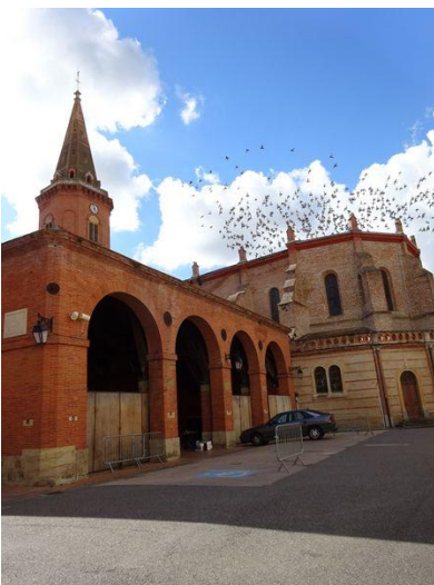
Eglise de Mazères et la halle