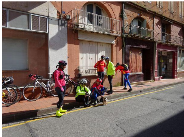
Arrêt et pointage à Mazères