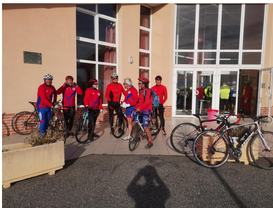
Ravitaillement à Lilhac